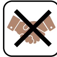
Vermeiden Sie jeglichen Körperkontakt