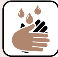
Waschen- und desinfizieren Sie sich Ihre Hände

Wir freuen uns, Sie wieder im Bullinger Eck begrüßen zu dürfen. Fühlen Sie sich bei uns wohl, wir sorgen für Ihre Sicherheit. Die Einhaltung der CoronaVO der Landesregierung Baden Württemberg ist bei uns gewährleistet.